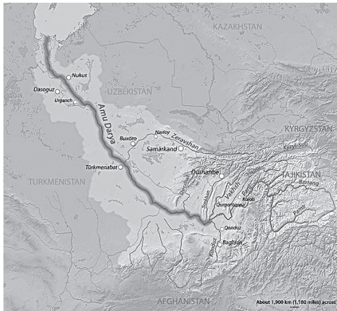
ایرانویچ در اطراف رود جیحون؛

(۱۸۴۹-۱۹۱۹م)، موفق به کشف شاخه‌های دیگری از زبانهای هندواروپایی شدند. مهاجرت اقوام هندواروپایی از دشتهای جنوب روسیه بسوی غرب احتمالاً از ۴۰۰۰ تا ۳۵۰۰ سال ق.م آغاز شده بود. امروزه دانشمندان خانوادهٔ زبانهای هندواروپایی را شامل ده شاخهٔ اصلی به این شرح میدانند: آریایی؛ آلبانیایی؛ آناتولیایی؛ ارمنی؛ ایتالیک؛ بالتی؛ تخاری؛ ژرمنی؛ سلتی و یونانی. ۱ در گیرودار مهاجرت اقوام هندواروپایی، گروهی از آنها در حدود هزارهٔ دوم پیش از میلاد از شمال آسیای میانه، بسوی جنوب سرازیر شدند. بخشی از این اقوام به حوالی رود جیحون رسیدند و در مناطقی که بعداً ایرانویچ نامیده شد، ساکن شدند.