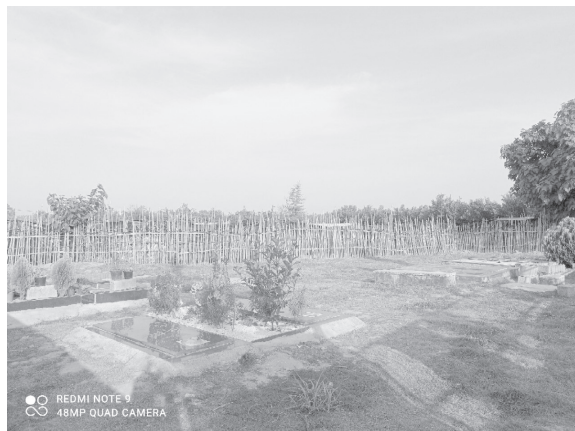
تصویر شماره ۵. گورستان وقفی شماره ۲، کاله شمالی در بهنمیر، بابلسر