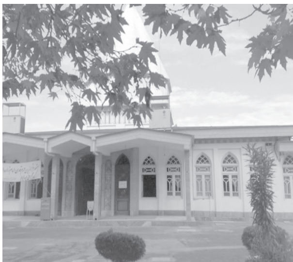
تصویر شماره ۷. امامزاده ابراهیم، آمل

همچنین امامزاده‌هایی با کارکرد آرامگاهی در شهر و روستاهای مازندران وجود دارد که هم موقوفات دارد و هم زمین آن وقف است، مانند امامزاده ابراهیم آمل (آقاعبدالله، [۹۲۶ هـ.ق]: آرشیو ۳۳۱). ۱