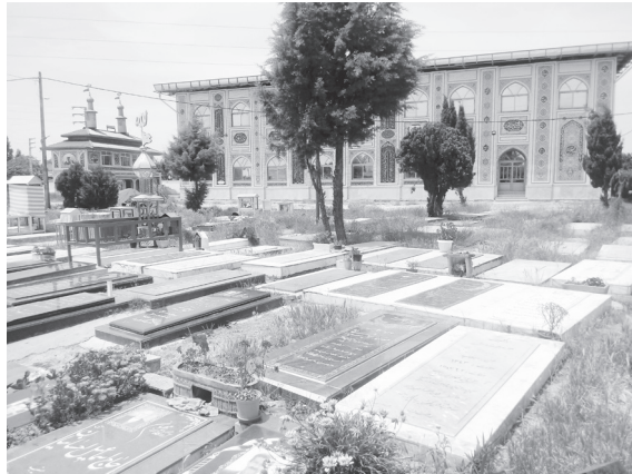
تصویر شماره ۴. گورستان وقفی شماره ۱، کاله شمالی در بهنمیر، بابلسر