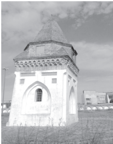
تصویر شماره ۲. گنبد ناصر کبیر، آمل

در مازندران این سنت از قدمت بالایی برخوردار بوده است که در این میان ابن اسفندیار به وقف بر قبر همسر حاکمان طبرستان و دیگران مانند گنبد دلارام گنبد زاهده خاتون سلجوقی