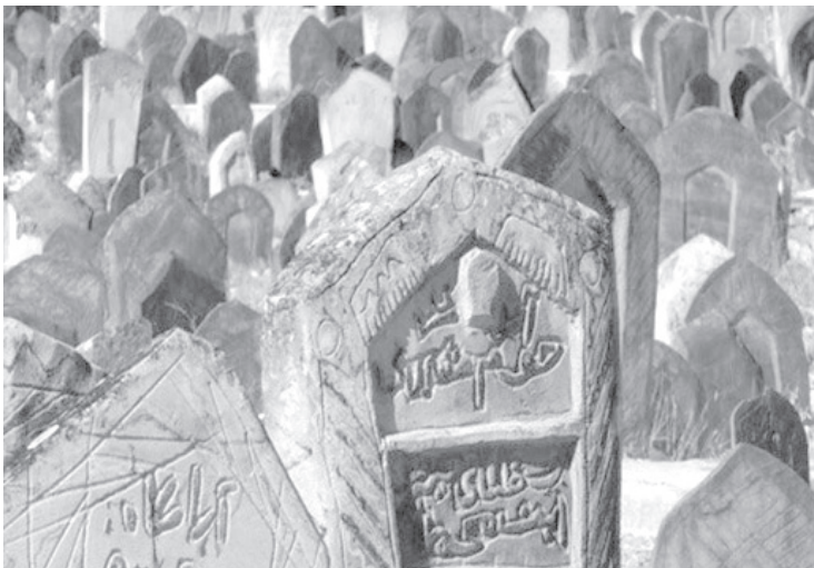
تصویر شماره ۳. گورستان سفیدچاه، قدیمی‌ترین گورستان اسلامی (سلطانی مجاوری، ۱۳۹۹)