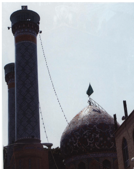
تصویر ۱. دورنمای گنبد و مناره‌ها

آرامگاه‌ها و مقابر، علاوه بر آن‌که مکانی برای ابراز احساسات پاک انسان‌هاست، تجلی‌گاه صور گوناگون هنری و فرهنگی آن جامعه مانند معماری، کاشی‌کاری، آینه‌کاری، شبیه‌خوانی و تعزیه‌خوانی است. از طرف دیگر کانونی برای برگزاری مراسم عزاداری و اعیاد، مولودی‌خوانی و سایر جشن‌های مذهبی است. چنین است که در بطن فعالیت‌های اجتماعی و فرهنگی این بقاع متبرکه، تحولات شکل می‌گیرند. نگاهی به الحاقات و فعالیت‌های صورت گرفته در امامزاده‌ها نشان می‌دهد که آستانه یک امامزاده صرفاً مکانی برای زیارت و قرائت فاتحه‌ای برای صاحب بقعه نیست. در سال‌های اخیر در پی تأکیدات رهبر معظم انقلاب بقاع متبرکه به قطب و بسترهای فرهنگی تبدیل شده‌اند.