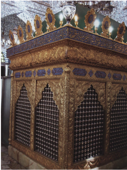
تصویر ۳. ضریح (اداره اوقاف و امور خیریه شهرستان کرج)