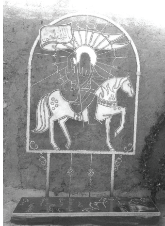
تصویر ۱. مزار انجم در روستای قدمگاه اطراف شازند

روستای قدمگاه شازند شناسایی و در سال ۱۳۹۰ به همت اداره ارشاد استان بازسازی شد.