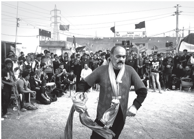
تصویر ۳. تعزیه‌خوان اراکی در حال اجرای تعزیه در عراق