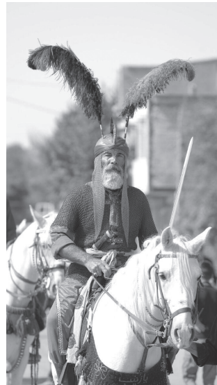
تصویر ۵. تعزیه‌خوانی سیار

در گذشته افرادی به عنوان نعلش در تابوت‌ها می‌خوابیدند و این تابوت‌ها را گروهی از مردم با ارابه‌ها حمل می‌کردند. در برخی از شهرهای ایران، کسانی که شبیه نعلش شده بودند، در ارابه‌هایی دراز می‌کشیدند و روی آن‌ها شن سرخ رنگ می‌ریختند؛ به طوری که فقط سرشان از زیر شن پیدا بود و بدین‌سان هم واقعه شهادت و هم صحنه واقعه دشت کربلا را به نمایش می‌گذاشتند. در تعزیه‌های سیار، دقیقاً تعزیه‌خوانی به صورت سیار و متحرک صورت می‌گیرد و نقش‌ها اقدام به خواندن اشعار می‌کنند.