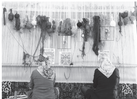
تصویر ۲) استفاده از مهره‌آبی و اسپند بر روی چله‌ها