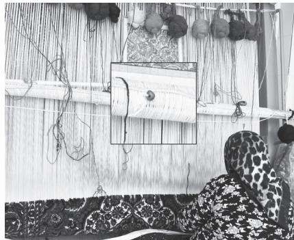
تصویر ۱) استفاده از مهره‌آبی بر روی کوچی

- نقشهای لوزی، نقوش جا پر کن و کوچک، نقش چار تیهو ترنج مرکزی بخصوص در بافته‌های عشایری نمادی از چشم هستند و برای دفع چشم بد بکار میروند (فرانک کبیری).