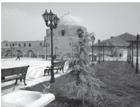
تصویر ۴: میدانگاه و مسجد جامع ارومیه

تابش مستقیم خورشید و عدم وجود عوامل طبیعی کنترل کننده در فضا مانند درختان بلند، سایبان، آلاچیق و... باعث عدم وجود مکانی مطلوب از نظر اقلیمی برای کاربران شده است. همچنین عدم توجه به جهت وزش باد در طراحی اقلیمی و فقدان المان و یا درختی برای جلوگیری از وزش باد به سمت محوطه، فضا را در معرض بادهای نامطلوب قرار داده است که همه این موارد باعث خالی شدن از حضور کاربر در ساعات روز شده است.