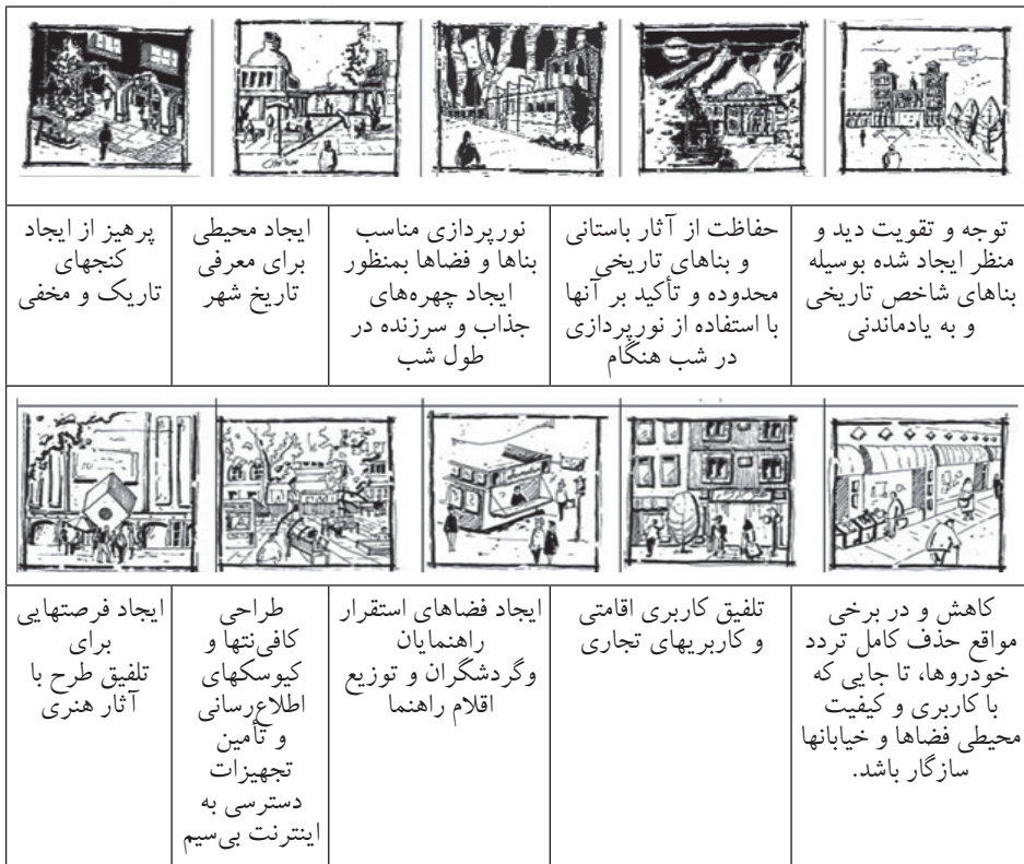
شکل ۱: بیان تصویری برخی از ضوابط طراحی (ادهم، ۱۳۸۹)

مجموعه پیشنهادی ضوابط عام طراحی که بر پایه معیارهای از پیش گفته بمنظور طراحی فضاهای باز شهری در این محدوده تدوین گردیده و بصورت گرافیکی درآمده‌اند و در نهایت با هدف تحقق اصول ارائه شده حرکت میکنند، در ادامه، در قالب توضیحات و پیشنهادات ارائه میگردد (مدنی پور، ۱۳۸۶: ۲۳۲).