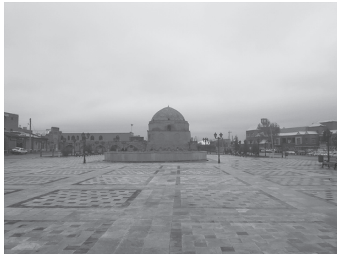
تصویر ۳: مسجد تاریخی جامع ارومیه (دید از میدانگاه)