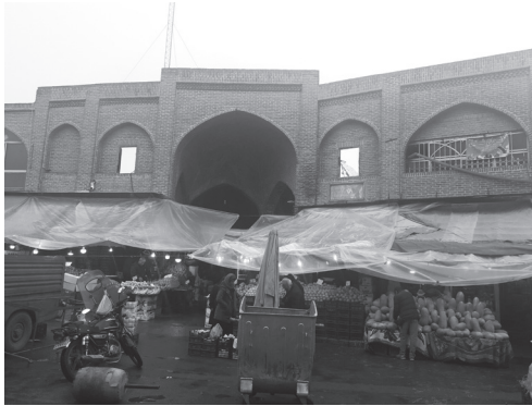
تصویر ۲: بازار ارومیه (ورودی راسته لبنیات‌فروشان)

بخصوص بخش تجاری آن منهدم گشته و اتصال آنها از هم گسیخته شده است. بطوری که در حال حاضر، قسمت کوچکی از بافت قدیمی بازار با حد فاصل دو خیابان و میدان نوساز در شمال شرقی شهر قرار گرفته و یکی از حمامهای قدیمی در قسمت دیگر شهر. در حال حاضر بخش عمده و سالم بازار قدیمی ارومیه در بین خیابانهای عسگرآبادی، امام، مهاباد و اقبال محصور میباشد. قدمت این بنا به دوره صفویه میرسد که در تاریخ ۱۳۶۲/۰۳/۲۲ به شماره ۱۶۳۹ در فهرست آثار ملی کشور به ثبت رسیده است (آرشیو مطالعات و اسناد کتابخانه‌ی میراث فرهنگی، صنایع دستی و گردشگری استان آذربایجان غربی، ۱۳۹۲: ۱).