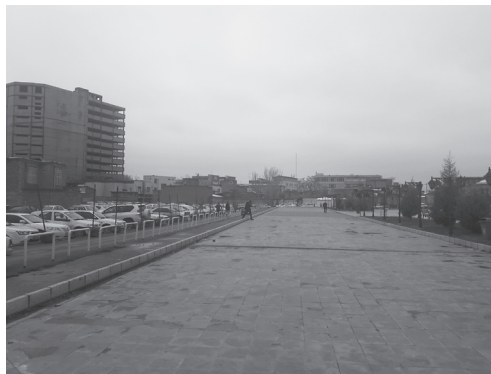
تصویر ۵: دید از میدانگاه به مخروطه‌های اطراف مجموعه

وجود بازار سنتی شهر ارومیه که در سمت شمال غرب قرار دارد و توجه به طراحی و ویژگیهای زیبایی‌شناسی آن و همچنین طراحی جز به جز عناصر در آن و از طرف دیگر، تردد افراد، باعث ایجاد منظره‌یی زیبا از طرف محوطه به بازار شده است. همچنین در سمت شمال شرق مجموعه، مسجد جامع ارومیه قرار دارد که دارای گنبدی زیبا، قدیمی و خوش ترکیب است که منظره‌یی زیبا ایجاد کرده و نیز مجتمع تجاری نارون واقع در شمال شرق محوطه که در سالهای اخیر احداث شده است، دارای طراحی جزئیات بنا و هماهنگی کالبد بنا میباشد و بخصوص سقفهای شیبدار آن با کل مجموعه، موجب معطوف شدن دید همگان بسمت آن شده است. در جنوب شرقی محوطه، پارکینگ طبقاتی قرار دارد که به حد ساخت و ساز ارتفاع غیر قانونی رسیده و در سمت جنوب مجموعه، خرابه‌هایی دیده میشود که منظر نامناسبی ایجاد کرده است.